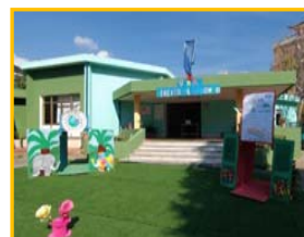
Scuola dell'infanzia F. Filzi