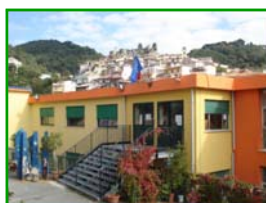
Scuola primaria e dell'infanzia S. Teodoro

Un ruolo di vitale importanza per la crescita della scuola viene ricoperto dal Comitato dei genitori, nato nel 2012.