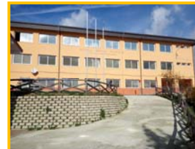
Scuola Infanzia, Primaria, I grado - Platania

Le iscrizioni si potranno inoltrare online sul sito del MIUR o direttamente sul sito dell'Istituto www.icdonmilanilamezia.edu.it Per la scuole dell'infanzia le iscrizioni si effettuano in modalità cartacea